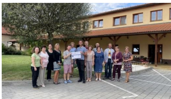
výjezdní zasedání ředitelů a ředitelk ZŠ Prahy 5 v Trnové

Projekt je zaměřen na pokračování a prohloubení partnerství aktérů působících v oblasti základního a předškolního vzdělávání nastaveného v projektu MAP I. Během projektu MAP II budou blíže definovány cíle a priority vzdělávací politiky na území MČ Praha 5 a v rámci implementace MAP také dojde k realizaci konkrétních naplánovaných cílů. Projektu se účastní 35 škol s RED IZO působících na území MČ. Hlavním výstupem projektu bude finální dokument MAP II. Projekt je realizován v letech 2019 až 2022. V rámci projektu byla opakovaně uspořádána charitativní akce pro děti nazvaná „Splněná přání do školních lavic“. Primárně byla určena pro rodiče samoživitele, kterým měla pomoci s finančně náročným začátkem školního roku tak, aby mohla být splněna přání a potřeby jejich dětí, pak se rozšířila na přání v průběhu celého školního roku. Byla zřízena e-mailová adresa pranidolavic@praha5.cz , kam přichází přání a nabídky, ty pak zveřejňujeme na webu MČ Praha 5. Lidé mohou zakoupit, případně přinést z domova zachovalé věci a předat je na dvou sběrných místech (ZŠ Grafická a oddělení strategického řízení a evropských fondů ÚMČ), odkud putují k dětem, převážně prostřednictvím škol. Aktuálně bude akce zopakována na konci projektu MAP II na podzim roku 2022. Pro děti také pořádáme soutěž Múzy na dálku, kde mohou literárně či výtvarně vyjádřit své pocity spojené se školou a volným časem ( https://muzynadalku.praha5.cz/ ).