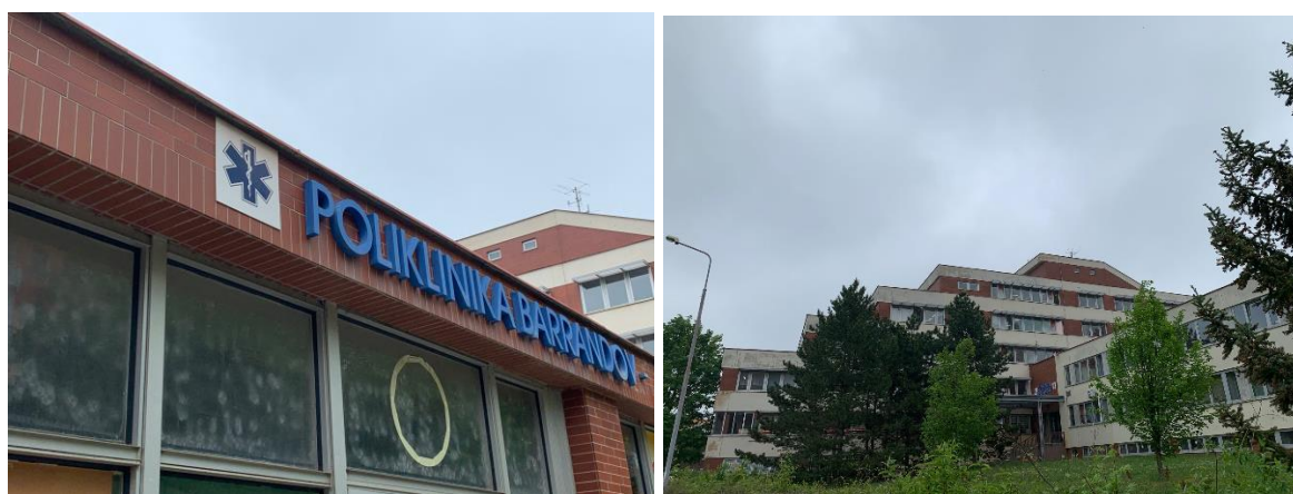
Stav před zahájením projektu

Žádost o dotaci z OP ŽP byla zařazena jako náhradní v pořadí schválených projektů. Proto RMČ schválila podání žádosti z Národního plánu obnovy, která je již podána. Max. výše podpory je v NPO 55 % uznatelných nákladů.