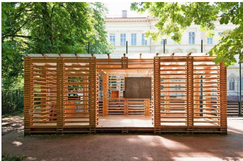
Ilustrační fotografie k záměru MŠ Slunéčko

Projekt přispěje ke zkvalitnění předškolního a základního vzdělávání ve vybraných školách na Praze 5. Cílem projektu je rozvoj klíčových kompetencí dětí/žáků zejména v oblasti přírodních věd a polytechniky prostřednictvím vybudování multifunkční roboticko-polytechnické učebny v ZŠ Chaplinovo nám., venkovní polytechnické a badatelské učebny v MŠ Slunéčko a modernizace a vybavení dvou tříd v MŠ Peroutkova moderními a funkčními polytechnickými prvky.