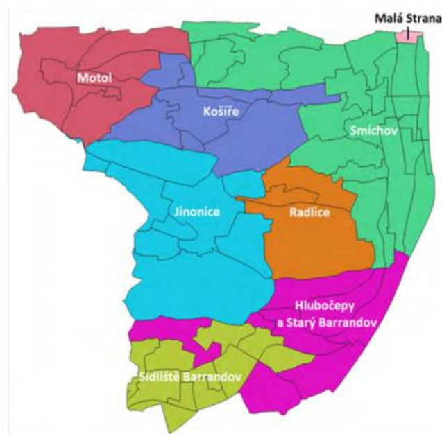
Mapa 1 | Identifikace sledovaných lokalit MČ Praha 5