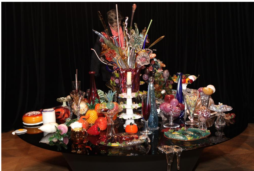
Hodovní stůl – dílo Miluše Roubíčkové