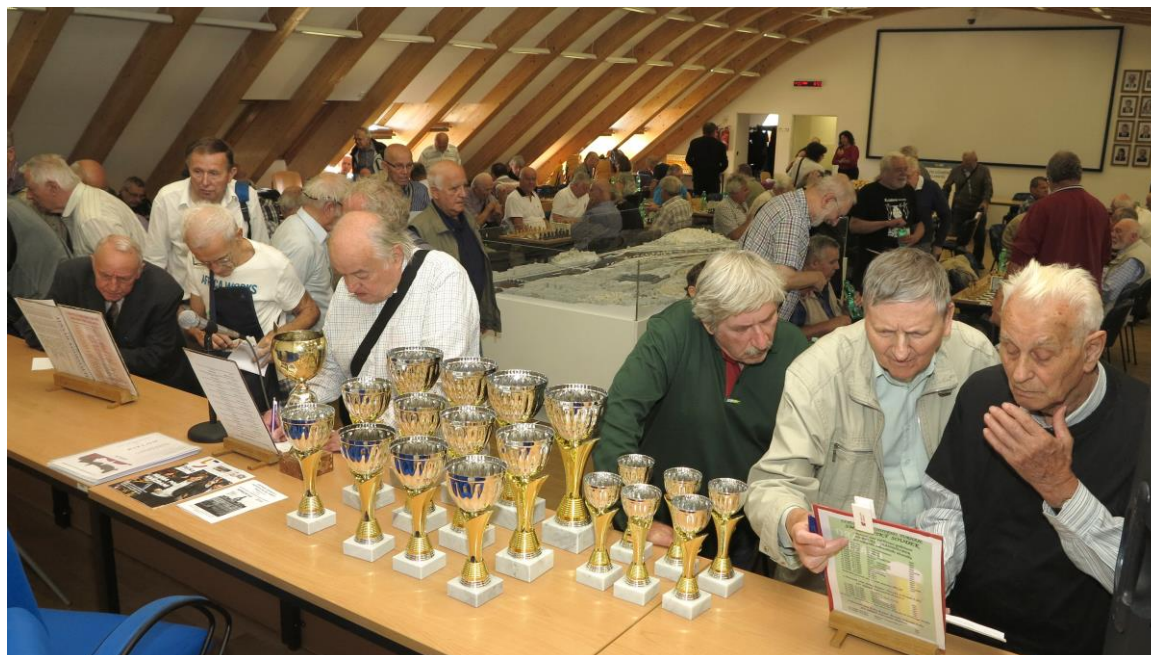
Účastníci šachového turnaje Senior-ka