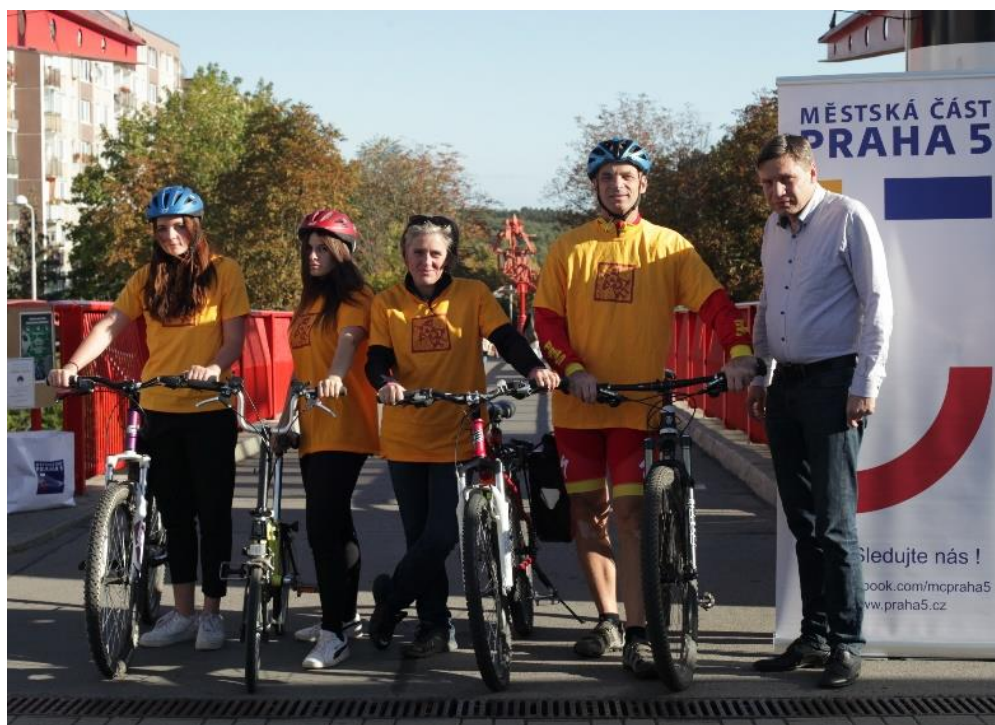
Tým Prahy 5 – cyklozvonění