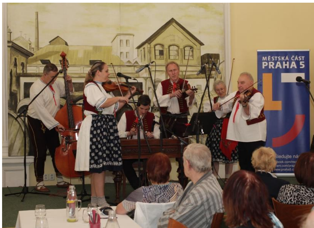
Hudební skupina Čtyřlístek