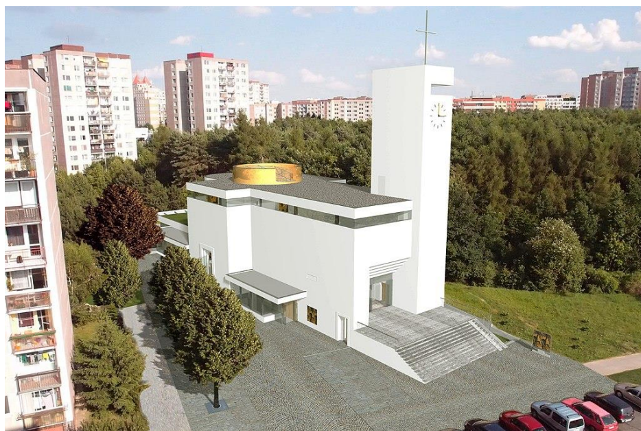
Kostel Krista Spasitele – vizualizace

samotném mezitím proběhlo několik podrobných průzkumů (dendrologický, geologický, hydrologický) a byl proveden zkušební vrt, který bude využit jako zdroj geotermální energie pro ekologické tepelné čerpadlo. Byly vykáceny dřeviny, které budou po ukončení stavby nahrazeny novými a zdravými stromy. V roce 2018 došlo k výběru generálního dodavatele, kterým se stala společnost Metrostav a. s.