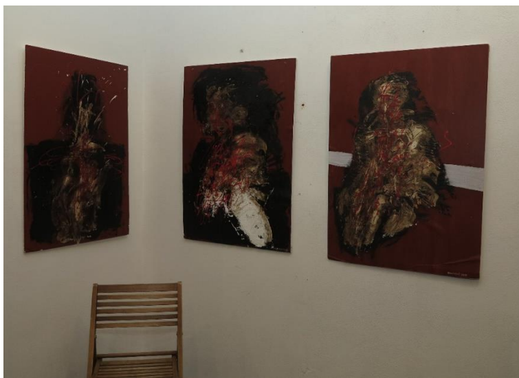
Dílo I. Bukovského