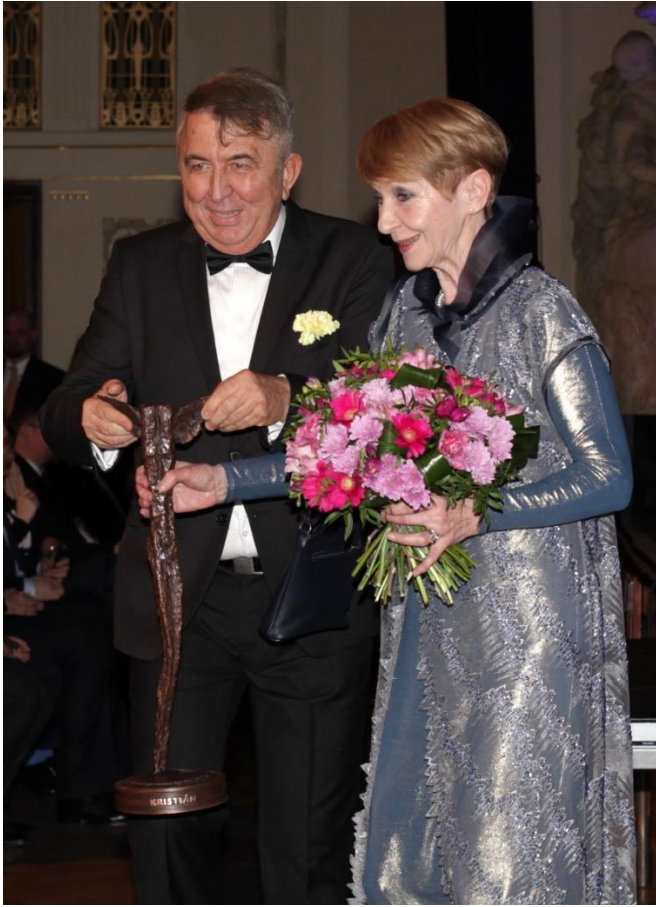
Daniela Kolářová s cenou za přínos kinematografii