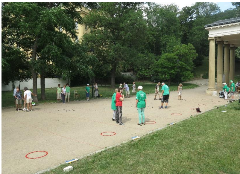
Pétanque u Musaionu