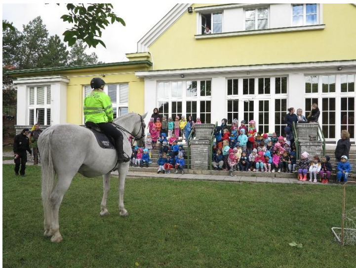
Předvedení jízdní skupiny