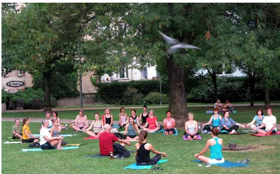
Jóga v parku Portheimka

I v roce 2018 zajistila MČ Praha 5 cvičení jógy pod širým nebem v parku Portheimka. Zájemci si mohli zdarma pod vedením lektorek z Domu jógy Anděl vyzkoušet blahodárné působení ásan na tělo i duši a uvolnit se pomocí relaxace. Cvičení se konala při příznivém počasí každou středu od 13. června do 12. září.