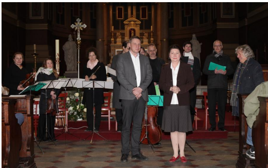
Zástupci MČ Praha 5 na koncertě duchovní hudby