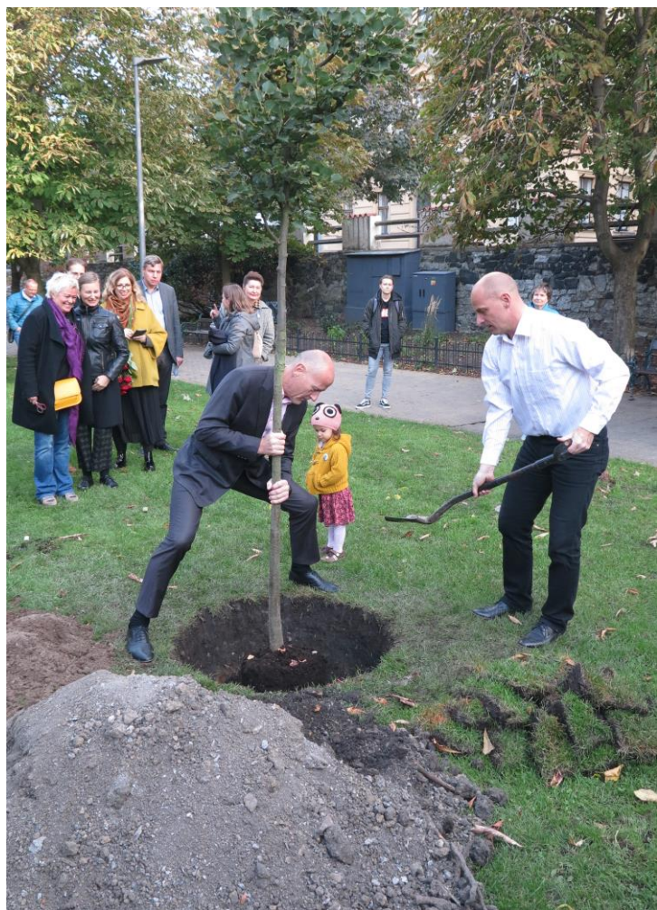
Zasazení 69. stromu Olgy Havlové