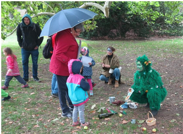
Pohádková postava ze strašidelného lesa

V rámci akce se návštěvníci mohli seznámit s činností příspěvkové organizace CSOP Praha 5 nebo se setkat s asistenčními psy z neziskové společnosti Helppees.