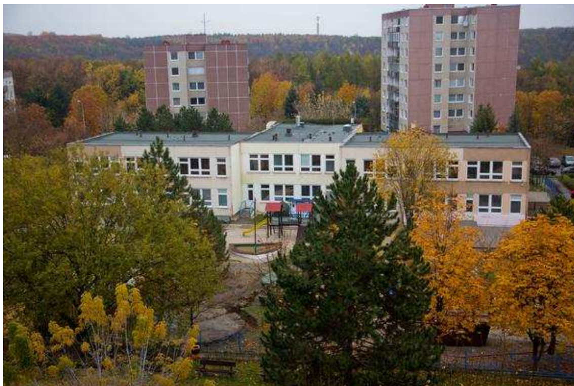
Stav MŠ Lohniského č.p. 830 před realizací projektu.

Snížení energetické náročnosti objektu mateřské školy zateplením obvodových stěn, zateplením ploché střechy, zateplením stropu nad suterénem, instalací solárního ohřevu vody, instalací systému nucené ventilace s rekuperací odpadního tepla a dalšími opatřeními včetně energetického managementu.