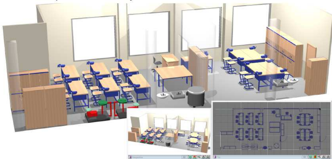
Obr. Stav po realizaci – Učebna dílny

Smyslem projektu je vytvoření kvalitních materiálních podmínek pro inovaci výuky a rozvoje gramotnosti a kompetencí žáků Fakultní základní školy a mateřské školy Barrandov II v oblasti polytechnické výchovy. Cílem projektu je vytvořit jednu novou odbornou učebnu Dílen pro polytechnickou výuku včetně vybavení nábytkem a nezbytnými pomůckami. Učebna bude vytvořena rekonstrukcí stávající učebny keramiky a grafiky.